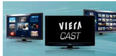
Panasonic: Viera Cast